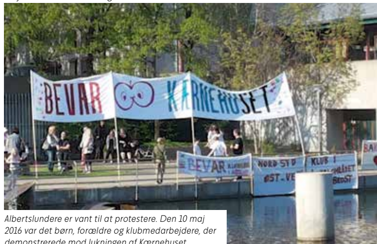
Albertslundere er vant til at protestere. Den 10. maj 2016 var det børn, forældre og klubmedarbejdere, der demonstrerede mod lukningen af Kærnehuset.

"omprioriteringsbidraget". Det var stadig en "stram" aftale, men trods alt lidt bedre end mange frygtede.